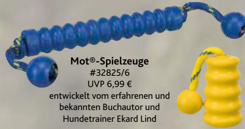
Mot®-Spielzeuge #32825/6 UVP 6,99 € entwickelt vom erfahrenen und bekannten Buchautor und Hundetrainer Ekard Lind