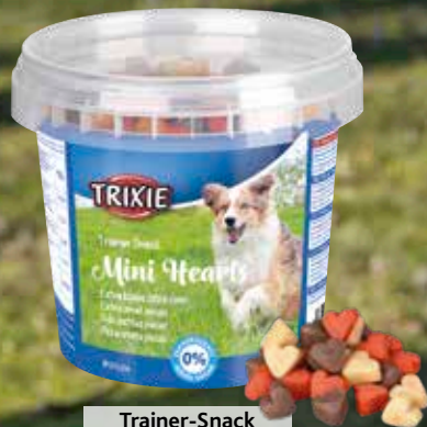
Trainer-Snack Mini-Hearts, 200 g #31524 UVP 1,99 €

Leckerlis eignen sich gut, um den Hund ruhig zu belohnen, neue Kommandos anzulernen und die Konzentration zu fördern.