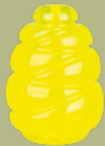
Jumper #32842/3 UVP ab 9,99 €