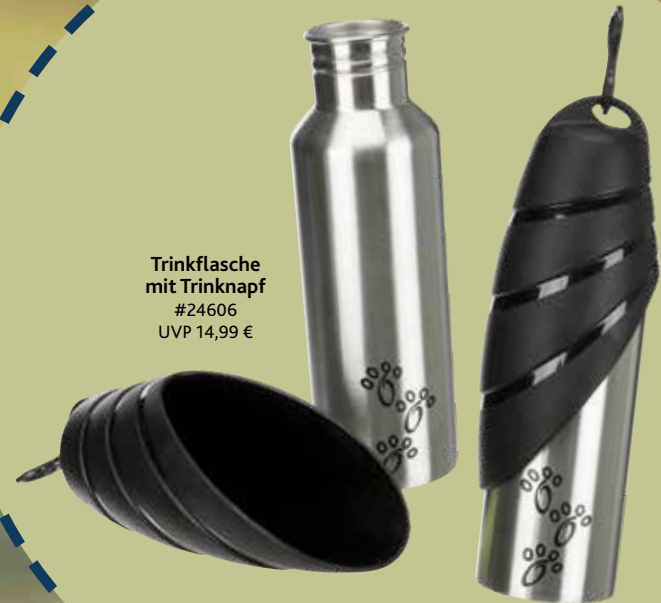
Trinkflasche mit Trinknapf #24606 UVP 14,99 €

Clickertraining ist deshalb so effektiv, weil mit dem Click-Ton ein sehr präzises Bestätigen und Loben sowie ein Training ohne körperliche Hilfe möglich ist.