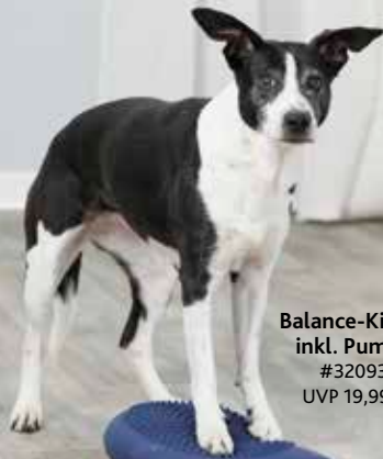
Balance-Kissen inkl. Pumpe #32093 UVP 19,99 €

Hindernisse und Balance-Kissen runden das Training ab und helfen dabei Konzentration, Körpergefühl und Koordination zu steigern. Durch individuelle Härtegrade oder diverse Steckmöglichkeiten sind die Artikel vielseitig einsetzbar. Sie sind auch für (physio-)therapeutische Anwendungen geeignet und können für alte und kranke Hunde, sowie nach Verletzungen zur Genesung beitragen.