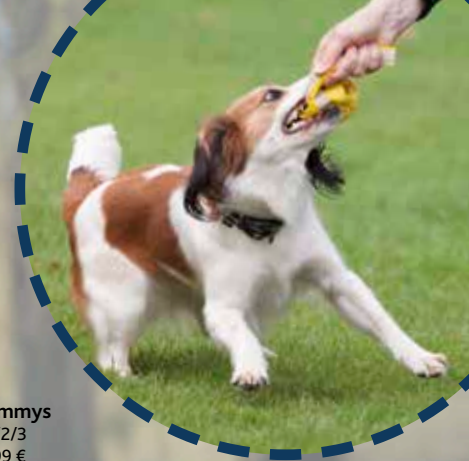
Trainingsdummys #32860/1/2/3 UVP ab 5,99 €