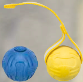
Bälle mit und ohne Gurt #32850/1 UVP ab 5,99 €