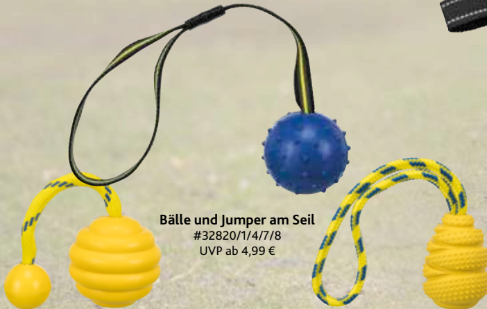
Bälle und Jumper am Seil #32820/1/4/7/8 UVP ab 4,99 €