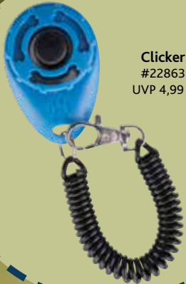
Clicker #22863 UVP 4,99 €

Der Clicker gewährleistet ein konstant gleichbleibendes Geräusch. Durch die Spiralschleife für das Handgelenk oder zur Befestigung z. B. an der Gürtelschleife ist der Clicker immer griffbereit.