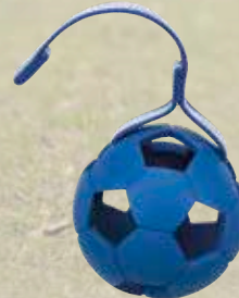
Lochbälle #32822/3 UVP ab 8,99 €