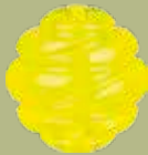
Ball #32840/1 UVP ab 6,99 €