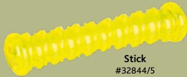
Stick #32844/5 UVP ab 8,99 €